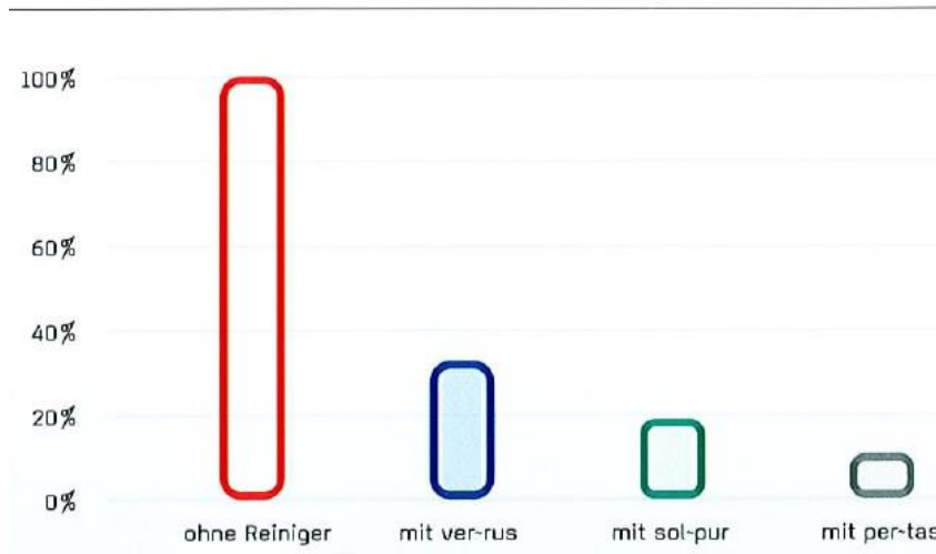
ROHMATERIALVERLUST in Kilogramm

Die durchschnittlichen Einsparpotentiale liegen bei kontinuierlichem Einsatz unserer Reiniger zwischen 50% und 80%.