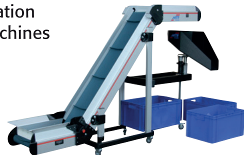
MTF Multi-Rounder MR-A1