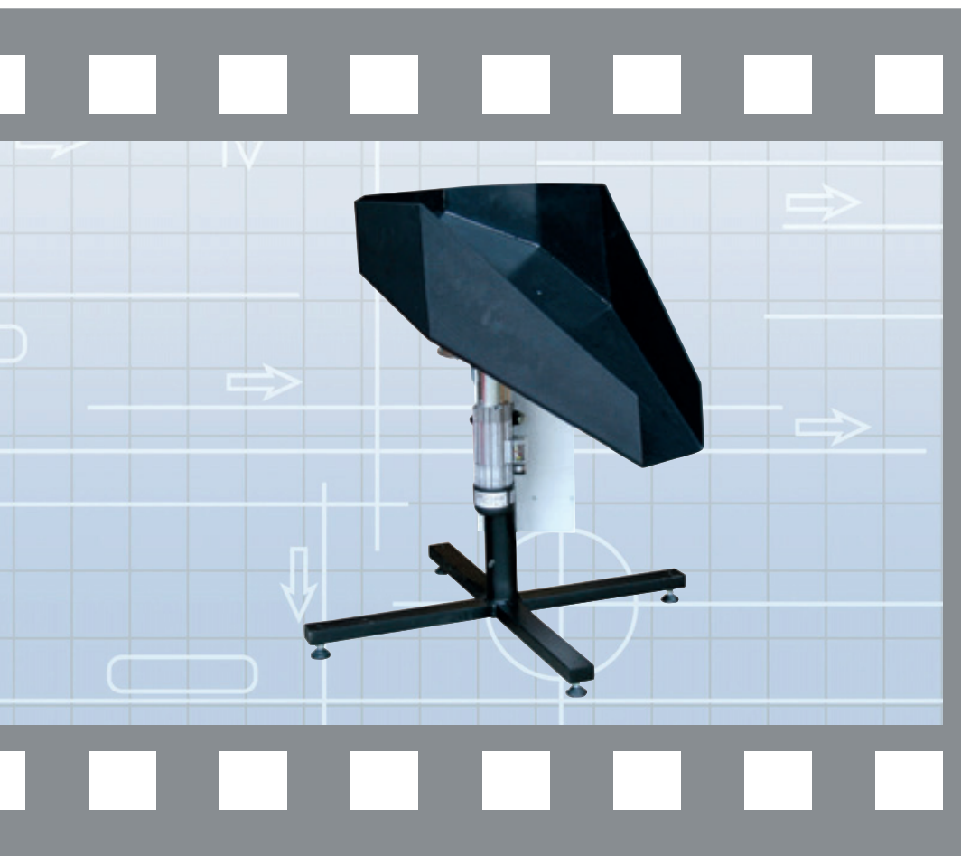
MTF Multi-Rounder MR-S1