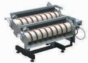
MSR 600 avec vis double pour pièces moulées sous pression