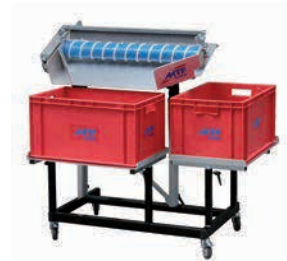
MSL 800 avec réceptacles pour containers