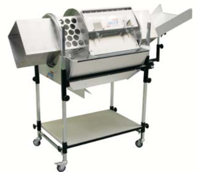
Combinaison du tambour rectangulaire et tambour perforé