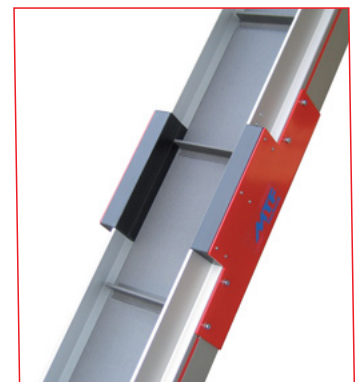
Flächen-Metalldetektor mit metallfreier Zone