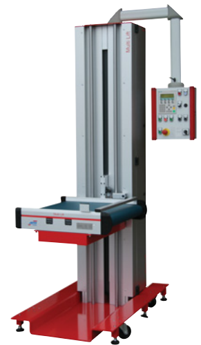
MTF Multi-Tech Lift ML 500-500 | ML 1.000-500